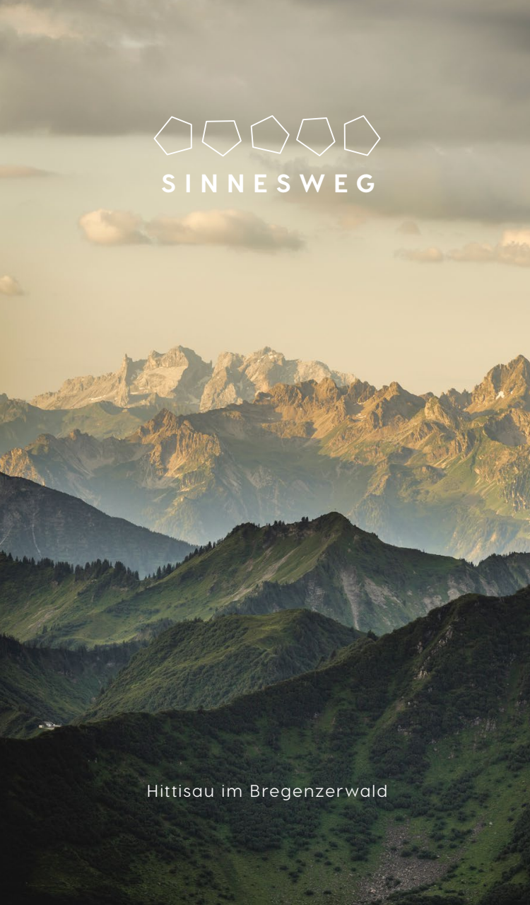
Hittisau im Bregenzerwald